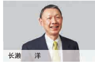
代表董事总经理兼执行董事