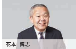
董事兼执行董事 加工材料事业·长濑应用研究院担当·色材 事业部长