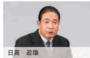
专职监事 1973年 长濑产业株式会社入社 2011年 现职