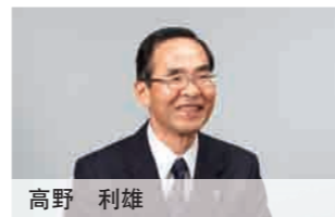
监事(外部监事) 1987年 东京地检特别搜查部副部长 2001年 仙台高检检察长 2004年 名古屋高检检察长 2006年 高野法律事务所 2008年 现职