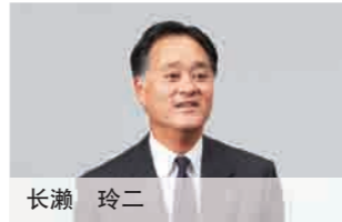
代表董事兼高级常务执行董事 株式会社林原担当