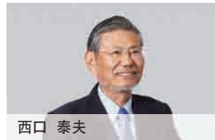
外部董事 1975年 京都陶瓷株式会社 (入取现京瓷株式会社) 1987年 该公司董事 1992年 该公司代表董事专务 1997年 该公司代表董事副总经理 1999年 该公司代表董事总经理 2003年 代表董事总经理兼执行董事总经理 2005年 代表董事会长兼最高经营责任者 (CEO) 2012年 现职