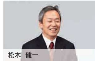
董事兼常务执行董事 人事总务部、法务审查部、物流运输管理部 本部长、知识产权和技术规划室长、监查室 担当