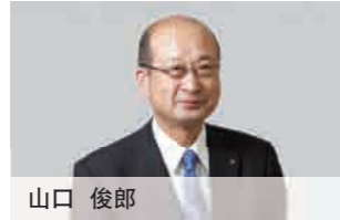
董事兼常务执行董事 机能素材事业·营业业务推进部担当