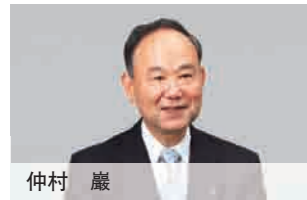
外部董事 1966年 日产汽车株式会社入社 1995年 该公司董事 2000年 该公司常务董事 2002年 日产Diesel工业株式会社 [现UD Tracks株式会社]代表董 事总经理 2009年 现职