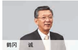
代表董事兼高级常务执行董事 财务部、会计部担当、经营企划室长、 信息系统部本部长