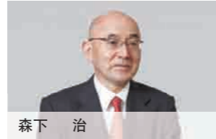
董事兼执行董事 生活关联事业·研究开发中心·大阪地区担 当