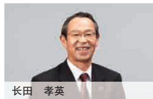
专职监事 1974年 长濑产业株式会社入社 2009年 现职