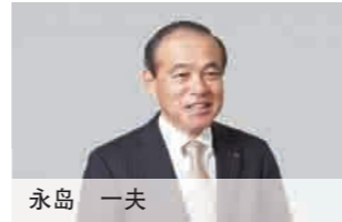
董事兼常务执行董事 电子事业·汽车·能源事业·美国地区·欧洲地区· 韩国担当