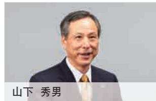
专职监事(外部监事) 1972年 株式会社住友银行入行 2000年 该行总部负责人、神田法人营业部长 2002年 株式会社三井住友银行总部高级调 查员 2004年 现职