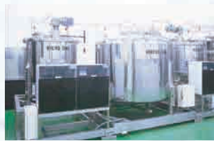
显像液稀释供给装置

长濑在国内外生产销售CMS (Chemical Management System = 化学管理系统)，该系统通过对半导体、液晶面板制造流程中药液性状的管理，确保工艺流程的稳定性和药液的再生利用。废弃溶剂回收系统将个别企业难以处理到零的废弃物，作为其他产业的原料加以利用，实施对废弃溶剂的回收、精练。