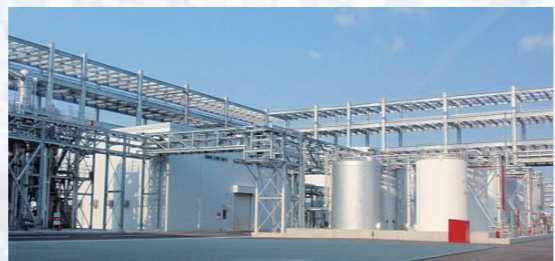
夏普株式会社“Green Front 堺”内的药液再生工场

此外，灵活运用本公司的技术、做法、实绩，建设了制造、供给、回收夏普株式会社的“GREEN FRONT 堺”内的液晶面板制造工程用的药液的现地车间，并于2009年10月开始投入生产。新工厂引进化学管理设备和长濑 ChemteX 株式会社的药液再生技术，再生显像液、剥离液。该项目凝聚了长濑集团长期以来积累的技术，这一构想的实现，将有可能大幅度削减药液的消耗量和原料，作为循环型工厂在环保方面做出巨大贡献。