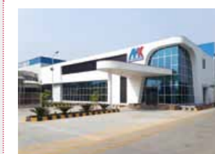
MINDA KYORAKU (印度)

向与印度大型汽车部件生产商UNO MINDA集团共同成立的合资公司MINDA KYORAKU公司进行追加出资：旨在进一步扩大在印度市场上的供应力度