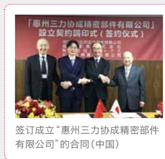
签订成立“惠州三力协成精密部件有限公司”的合同(中国)