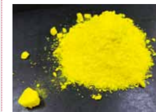
Kyulux开发成功的发光材料