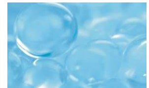
※セラミドファンクション(イメージ)