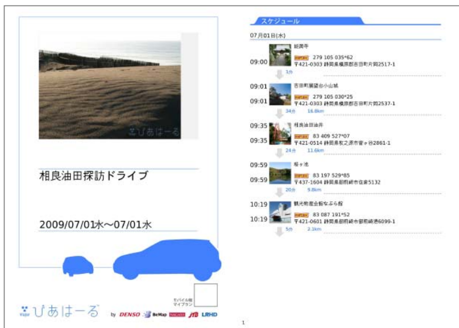
ドライブプランのしおり (例)