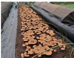
◀ 国内の契約農家で栽培

発酵する時まで酵素を失活させないよう、自己発酵までの工程には繊細さを必要とし、隅々までこだわりをこめた独自の手法をとっています。