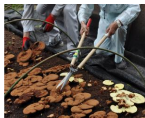
◀ 一つ一つ 笠の部分だけを丁寧に収穫