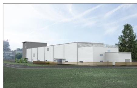
「ゼノマックス®」生産工場 完成予想図