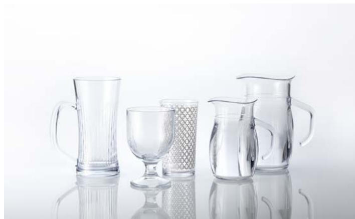
写真：サイゼリヤで導入されるジョッキ、ワイングラス、ジュースグラス、デカンタ 250ml、同 500ml（左から）

トライタンは業務用食器向け樹脂として注目されており、長瀬産業では今後も本用途を中心に市場の拡大を目指します。