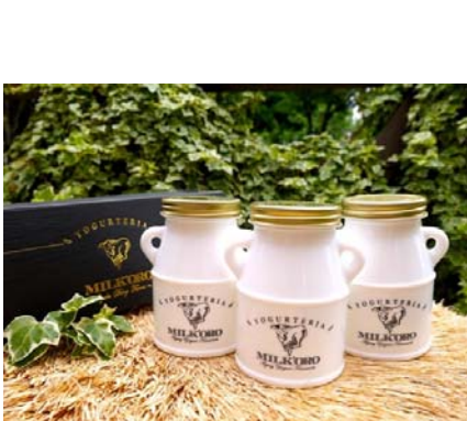
④ エイジングヨーグルト