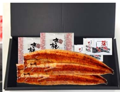
③うなぎ長焼 肝吸い付