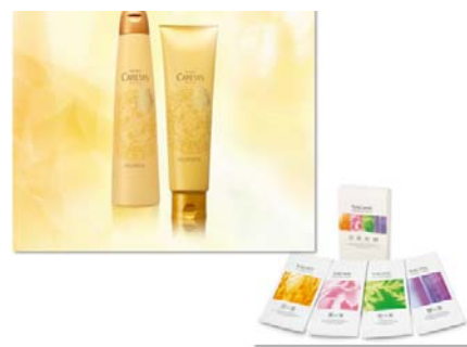
⑥ナガセ ヘアケア & バスセット