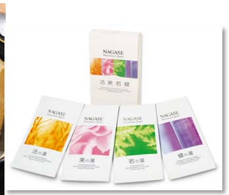
⑥ ナガセ プレミアム バス