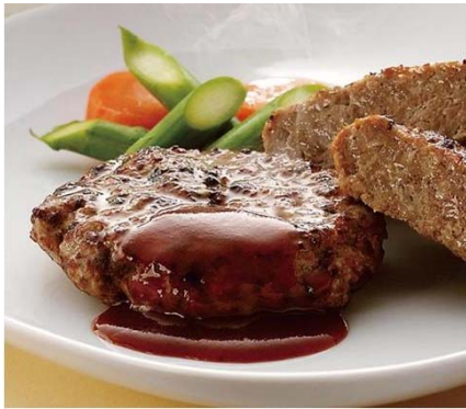
① 短角和牛 生ハンバーグ