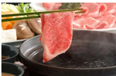
②よくばりしゃぶしゃぶセット