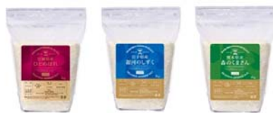
⑤厳選米 食べ比べセット