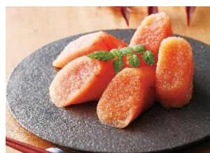
③やまや 辛子明太子