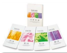
⑦ナガセ プレミアム バス