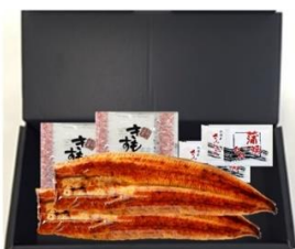
①うなぎ長焼 肝吸い付

※寄付は、個人名では行いません。お申し出いただいた件数・金額を集計し、当社が一括して寄付いたします。