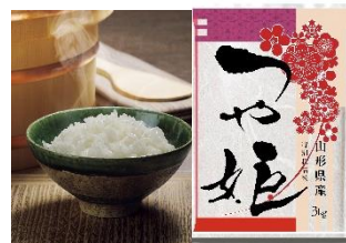
④特別栽培米つや姫