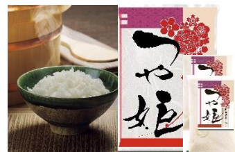
④特別栽培米つや姫