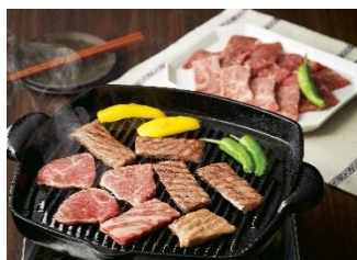
⑤鹿児島黒牛 カタローズ焼肉