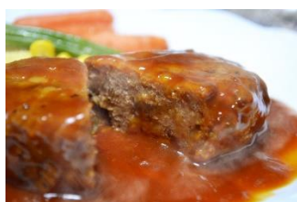
①飛騨牛仕込み 焼きハンバーグ 煮込みハンバーグ

※寄付は、個人名では行いません。お申し出いただいた件数・金額を集計し、当社が一括して寄付いたします。