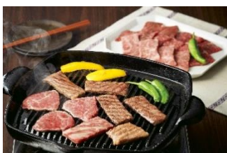
⑤鹿児島黒牛 カタローズ焼肉