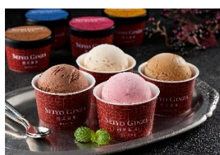
⑥西洋銀座監修 アイスギフト