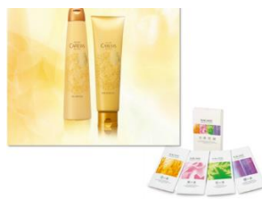
⑦ナガセ ヘアケア & バスセット