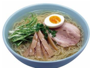
⑤福島鶏塩ラーメン