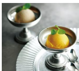
⑥リストランテ・サバティーニ青山 アイスセット