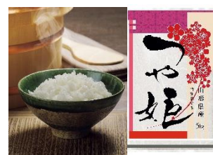
④特別栽培米つや姫