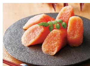
③やまや 辛子明太子