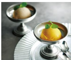
⑥リストランテ・ サバティーニ青山 アイスセット