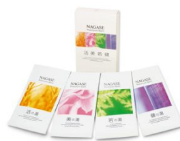
⑦ナガセ プレミアム バス