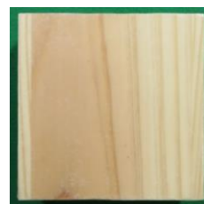
塗装後 透明で木目が見える