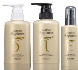
⑪ナガセ ヘアケアセット