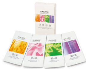
① ナガセ プレミアム バス

※寄付は、個人名では行いません。お申し出いただいた件数・金額を集計し、当社が一括して寄付いたします。