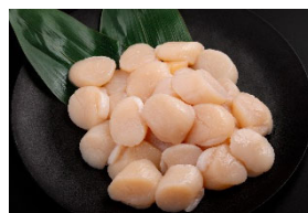
③北海道産 お刺身用 帆立貝柱