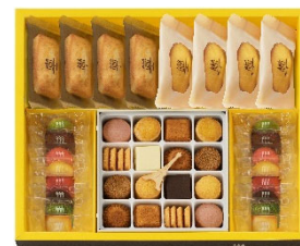
⑧プティ・タ・プティ・アソート L ボックス