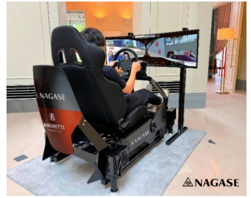
シミュレーター (イメージ)