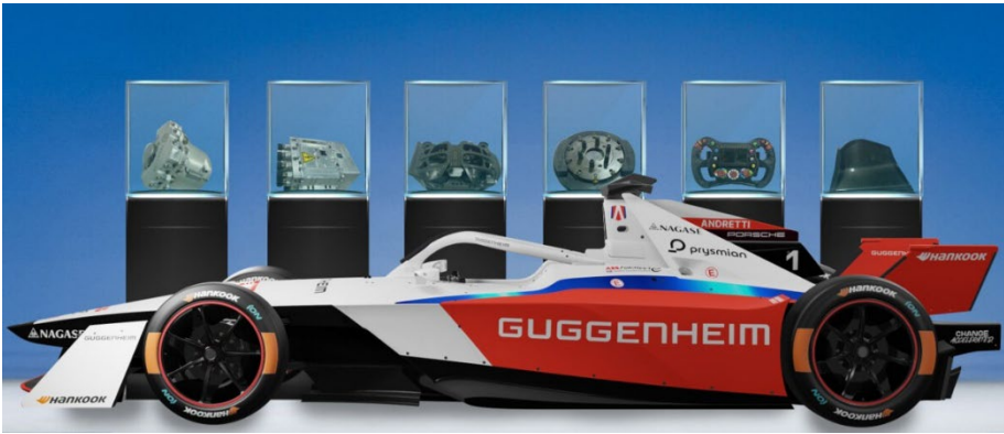
車体展示 (イメージ)

【期間】 5 月 9 日(金)、5 月 10 日(土) ※シミュレーター体験は 10 日(土)のみ