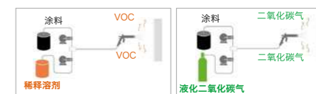
图1 溶剂涂装(已有的) 图2 碳酸混合涂装

“碳酸混合涂装系统”可设置在已有的溶剂性涂装室，与水性和液体涂装相比，能够低成本引进，被期待为新型环保涂装系统。“碳酸混合涂装系统”的事业化为目的，根据知识产权战略进行着更多的专利申请。