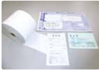
Color Former 生产和销售用于发票和车票等感热纸的Color Former。