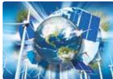
环氧树脂 生产和销售电子部件、风力发电、太阳能电池、飞机、光学部件等领域使用的高功能树脂。