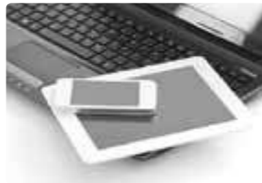
液晶、软性显示器、有机EL材料 面向智能手机、平板电脑行业销售显示器关联部件、触摸面板部件、药剂和设备等。