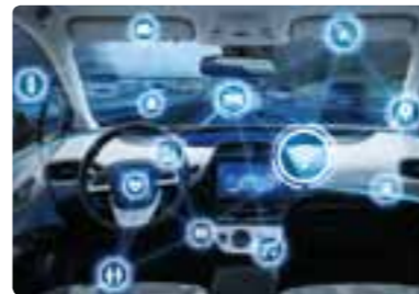
应对新一代技术的努力 提供汽车多媒体、传感器、无人驾驶系统所需要的部件、新素材及相关技术。