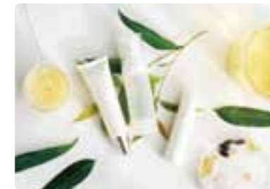
香料产品和化妆品领域 生产和销售香料产品和化妆品原料、产品以及健康食品。