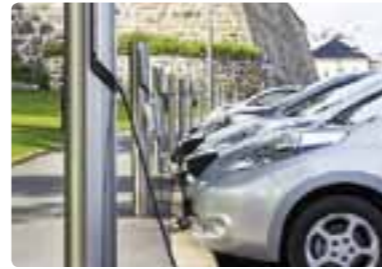
汽车电子 不断提出下一代环保车关联新素材、部件、新技术的项目。