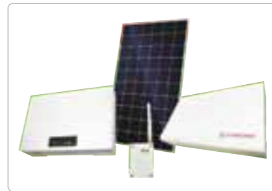
HEMS 和客户一起推进HEMS (家庭能源管理系统) 的企划和开发。