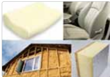
聚氨酯原料 销售拥有高密度和弹性，用于车椅靠背等的聚氨酯原料。