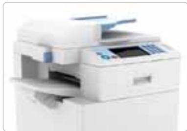
工程塑料 销售用于OA机器等的树脂。