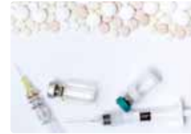
医药和医疗领域 销售医药原料，以及生产和销售抗癌剂。