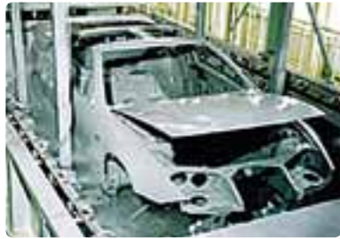
涂料原料 销售用于汽车车身等的涂料原料。