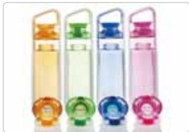
共聚多酯树脂 (Tritan™) 耐热性提高到100℃以上的共聚多酯树脂。弥补餐具等玻璃制的缺点，作为代替品广泛使用。