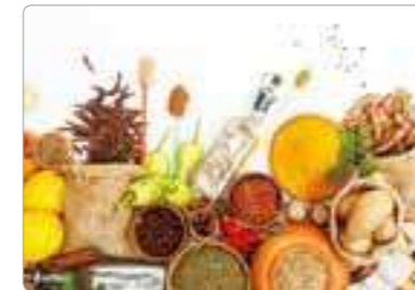
食品领域 生产和销售以功能性糖质、酵素为中心的食品素材、健康食品素材。