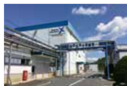
长濑 ChemteX 株式会社 福知山事业所

生产食品添加剂和健康食品素材的福知山事务所，除按照ISO9001、食添GMP（Good Manufacturing Practice）外，还按照2019年度获取的食品安全国际规格FSSC22000，从原材料的采购到生产、质量管理以及出货进行着严格管理。