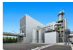
株式会社林原 冈山功能糖工厂

除全公司取得的ISO9001认证以外，还以主力产品TREHA™为对象，取得了FSSC22000认证。此外，在原料药、医药品以及医药品添加剂各方面均符合GMP标准，从原材料采购到生产、质量管理以及出货进行着严格管理。